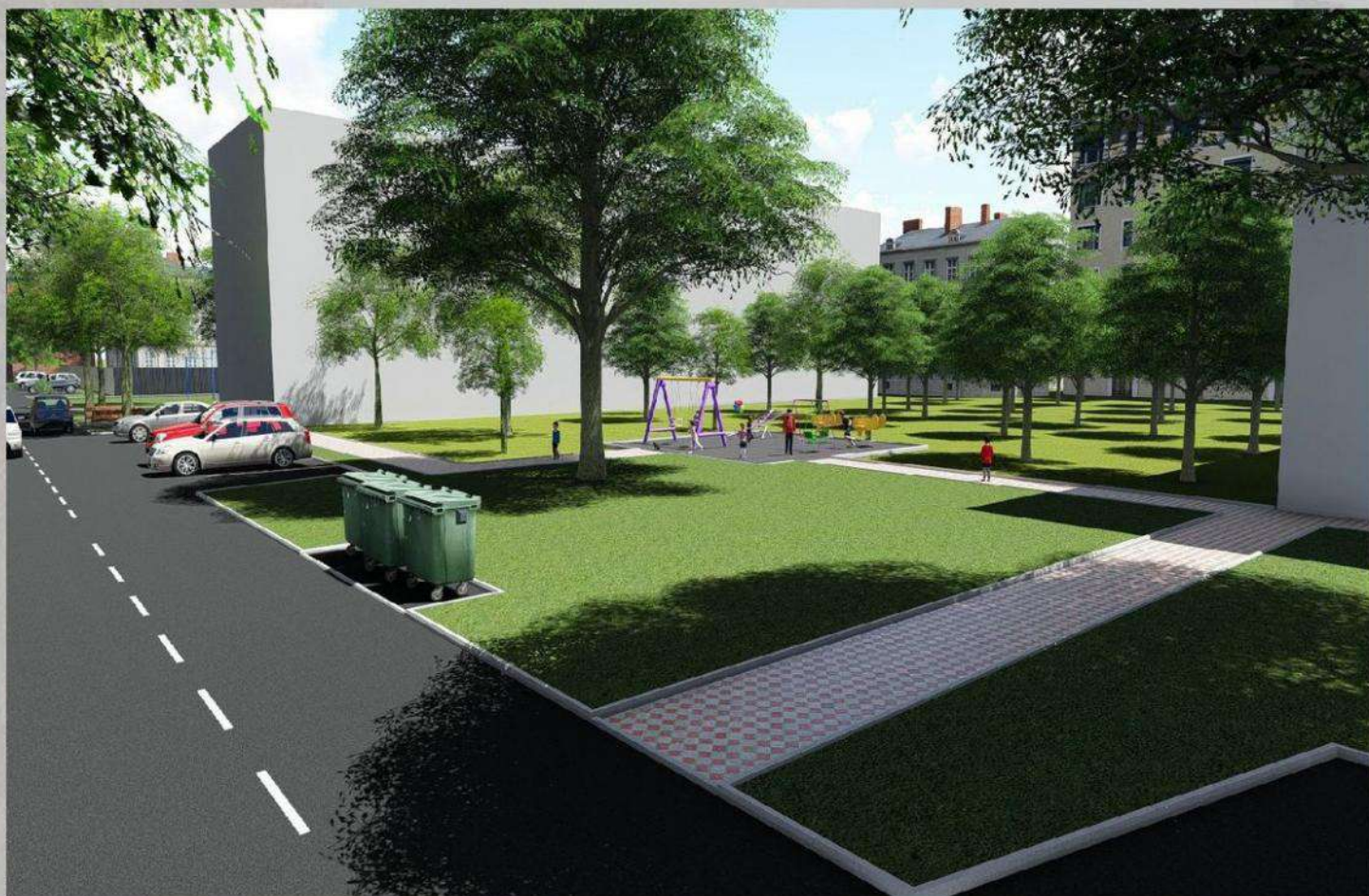
«Благоустройство общественной территории в г. Малгобек (дворовая часть дома №4 по ул. Осканова)»