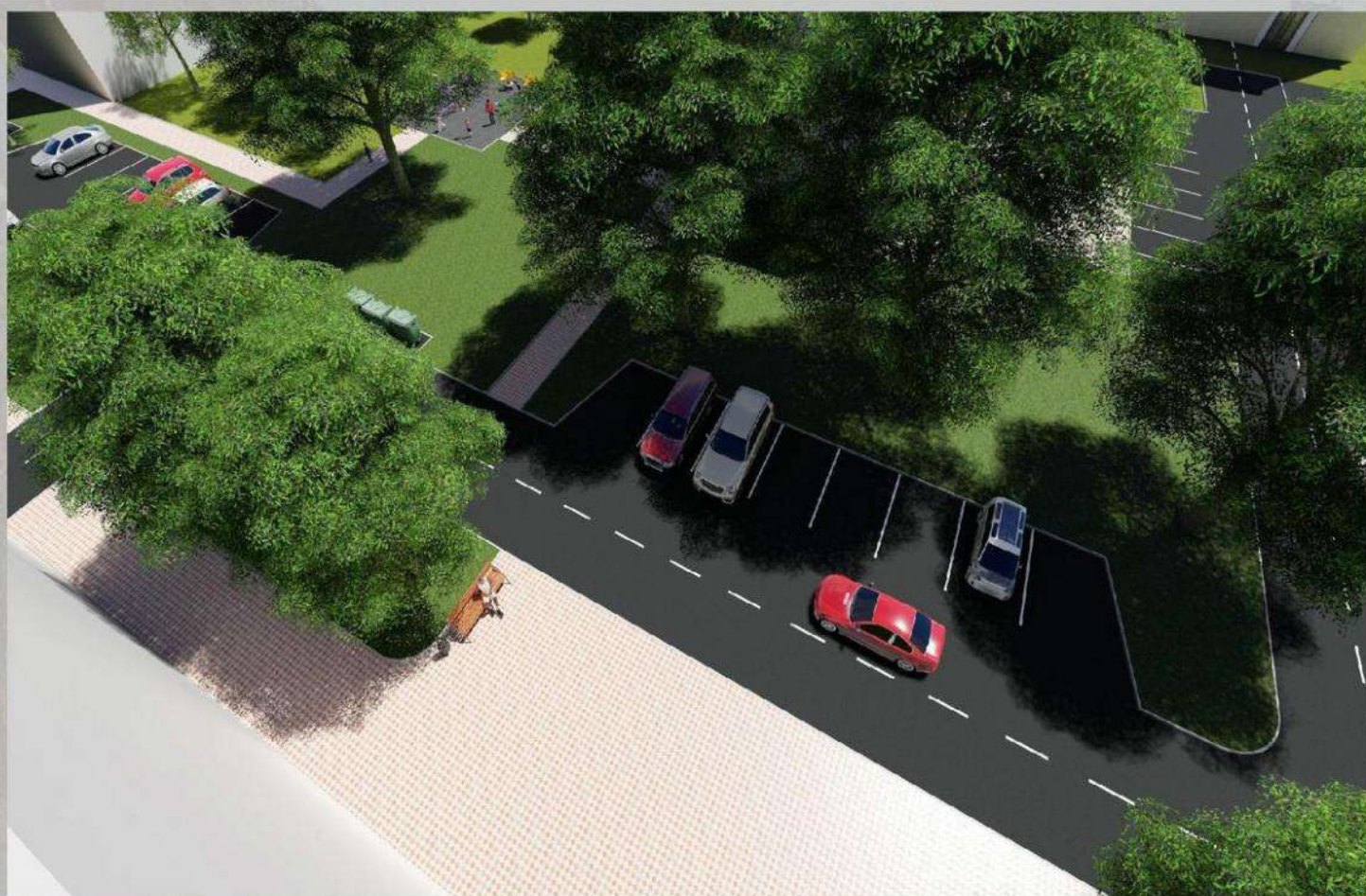
«Благоустройство общественной территории в г. Малгобек (дворовая часть дома №4 по ул. Осканова)»