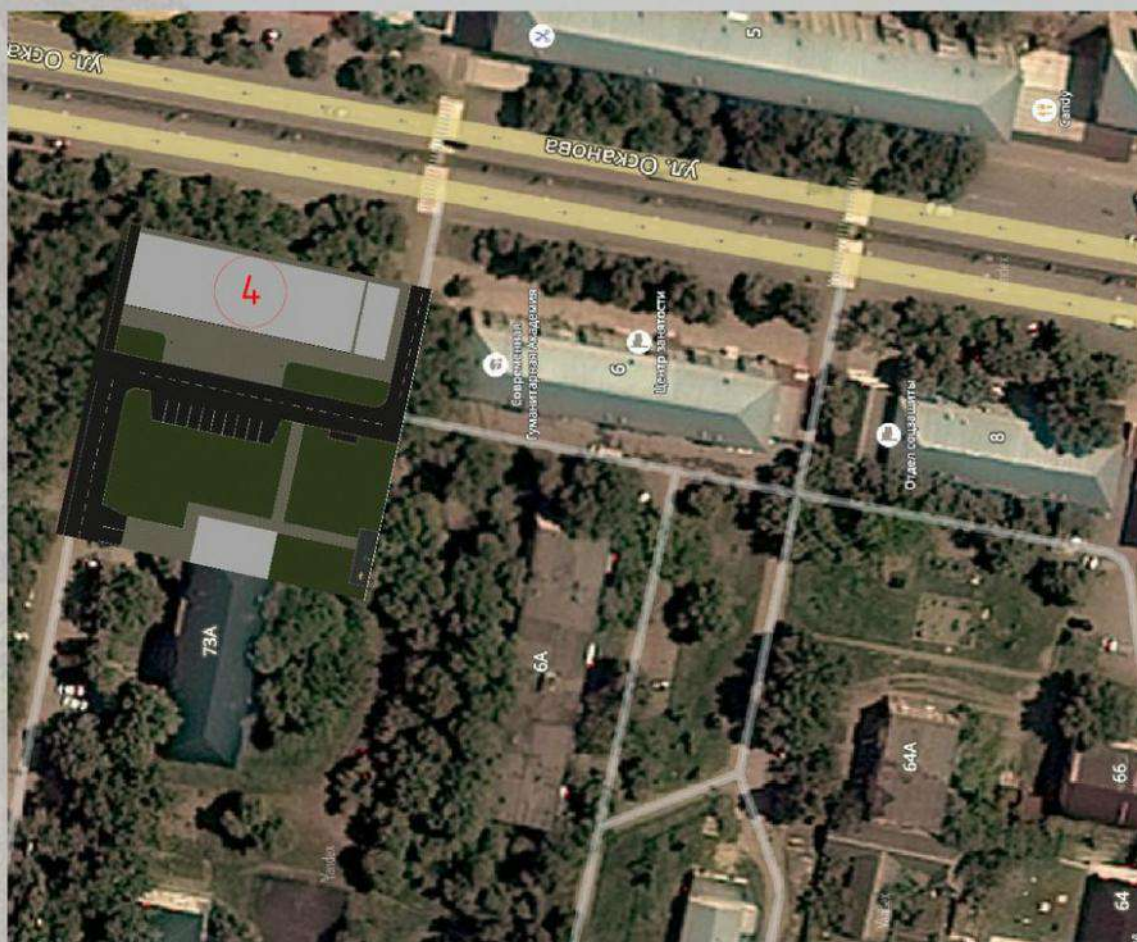
«Благоустройство общественной территории в г. Малгобек (дворовая часть дома №4 по ул. Осканова)»