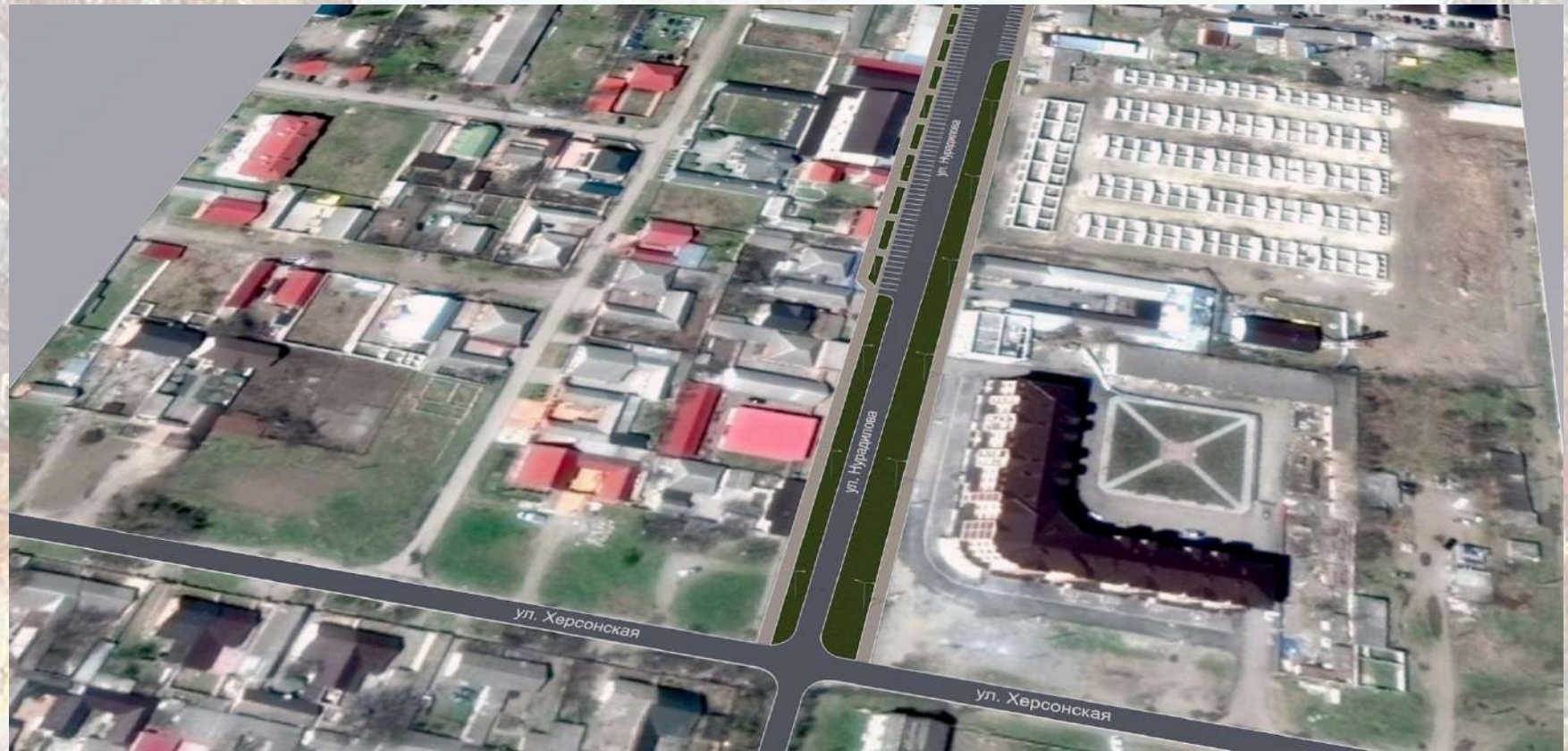
«Благоустройство общественной территории в г. Малгобек (участок улицы Нурадилова)»