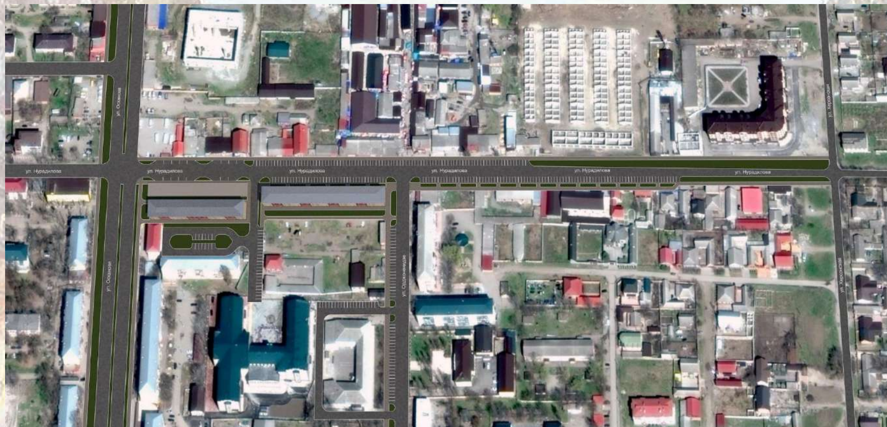
«Благоустройство общественной территории в г. Малгобек (участок улицы Нурадилова)»