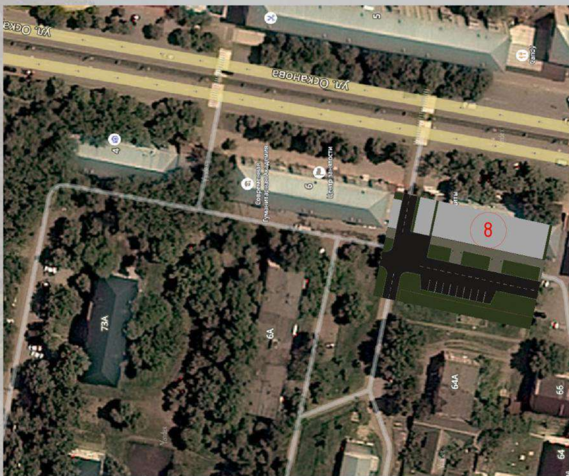
«Благоустройство общественной территории в г. Малгобек (дворовая часть дома №8 по ул. Осканова)»