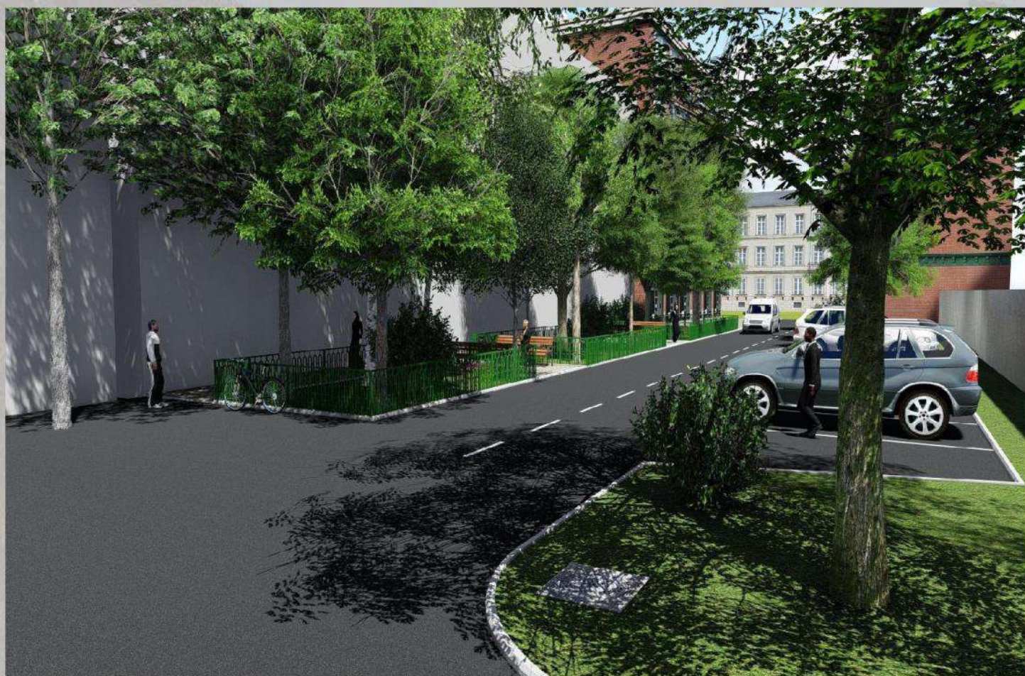
«Благоустройство общественной территории в г. Малгобек (дворовая часть дома №8 по ул. Осканова)»