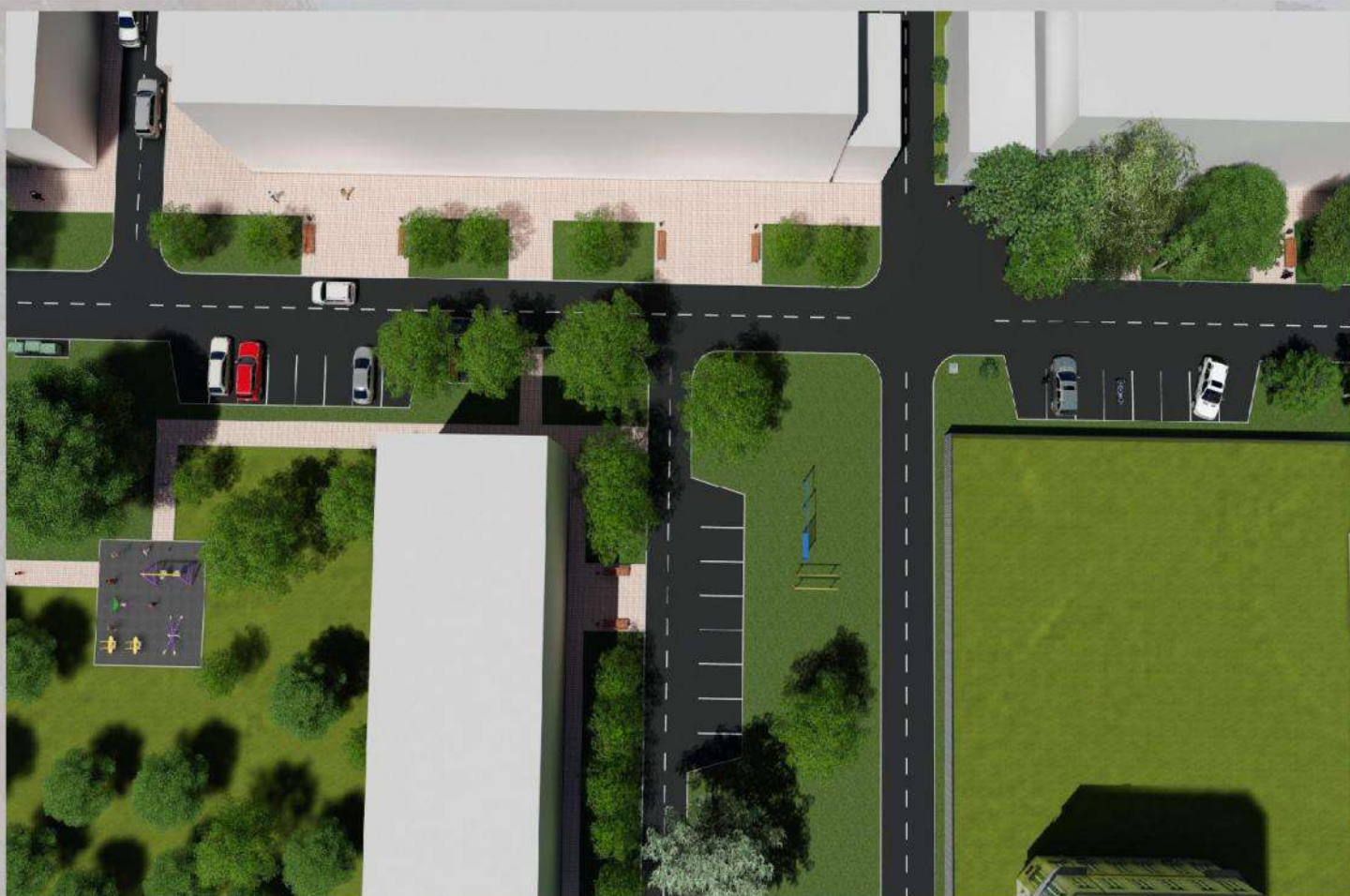
«Благоустройство общественной территории в г. Малгобек (дворовая часть дома №8 по ул. Осканова)»