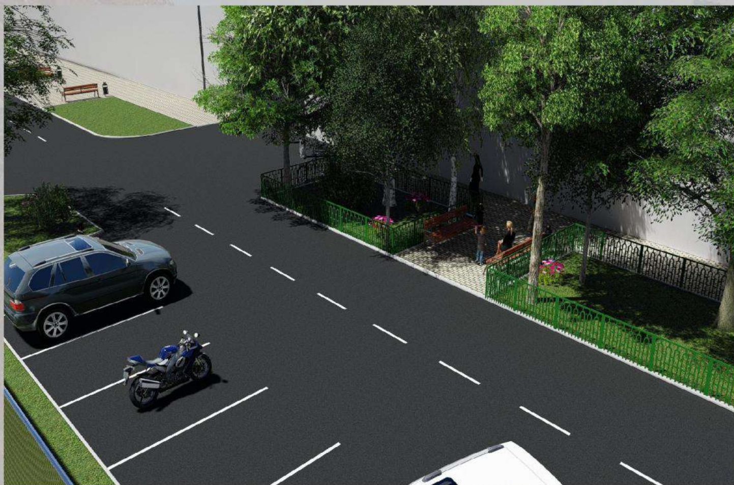
«Благоустройство общественной территории в г. Малгобек (дворовая часть дома №8 по ул. Осканова)»