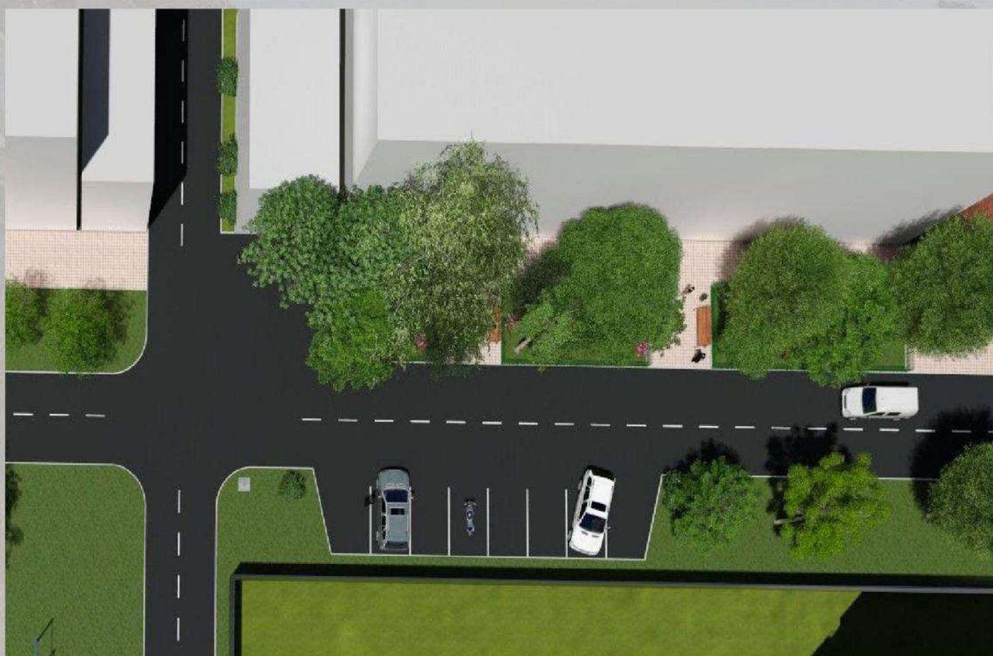
«Благоустройство общественной территории в г. Малгобек (дворовая часть дома №8 по ул. Осканова)»