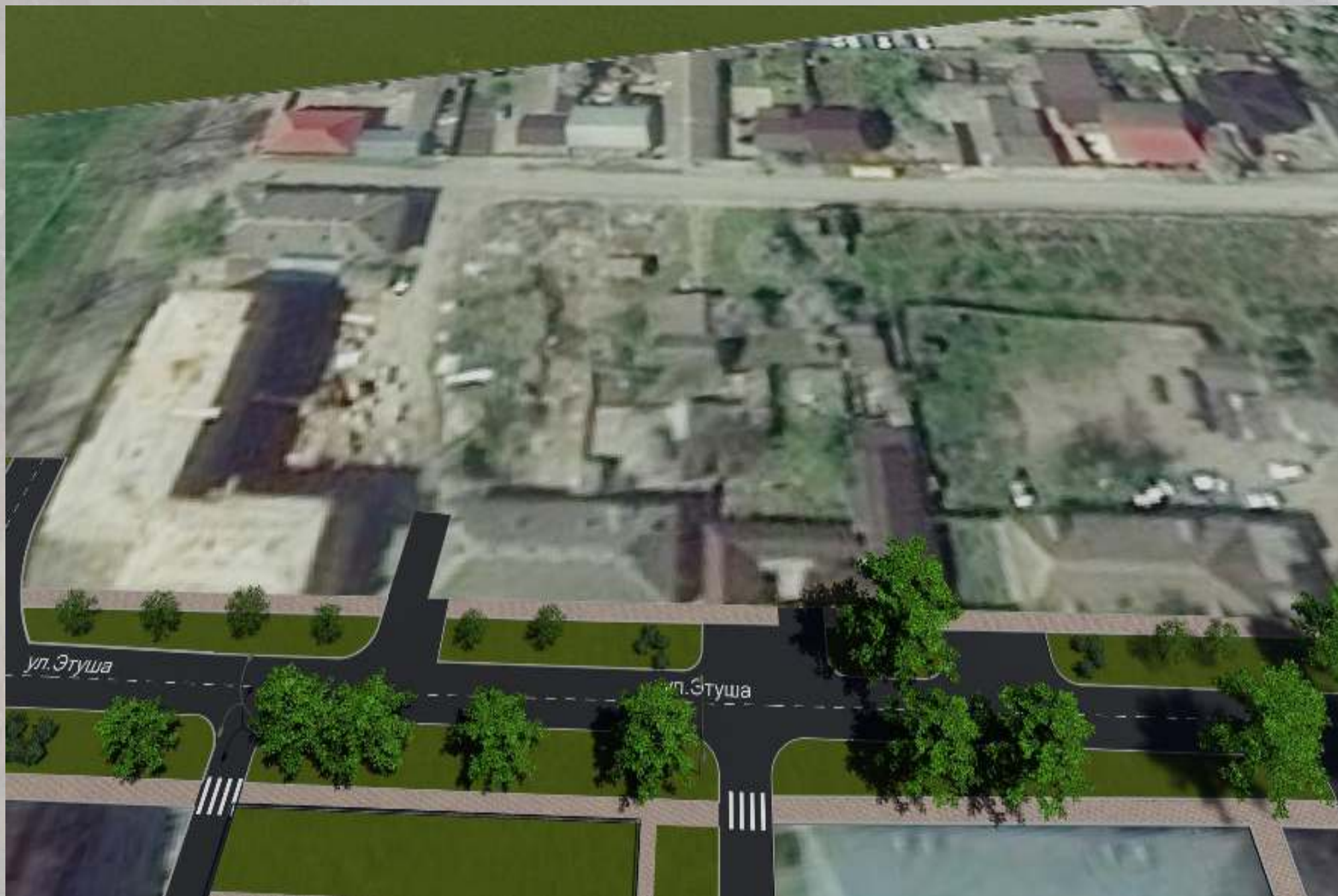
«Благоустройство общественной территории в г. Малгобек (ул. Этуша - от ул. Базоркина до ул. Нурадилова)»