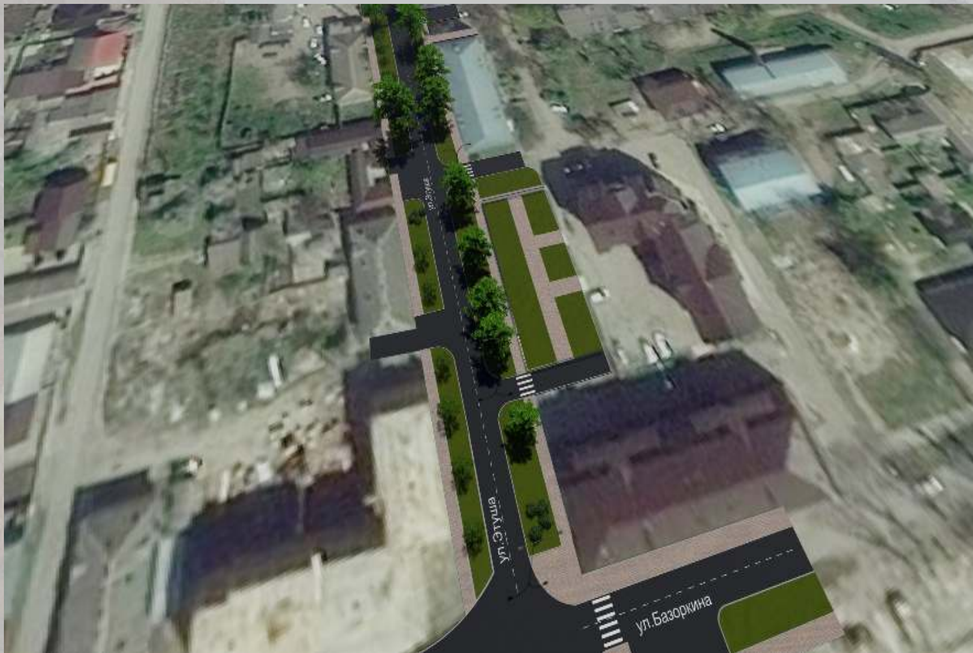
«Благоустройство общественной территории в г. Малгобек (ул. Этуша - от ул. Базоркина до ул. Нураилова) »