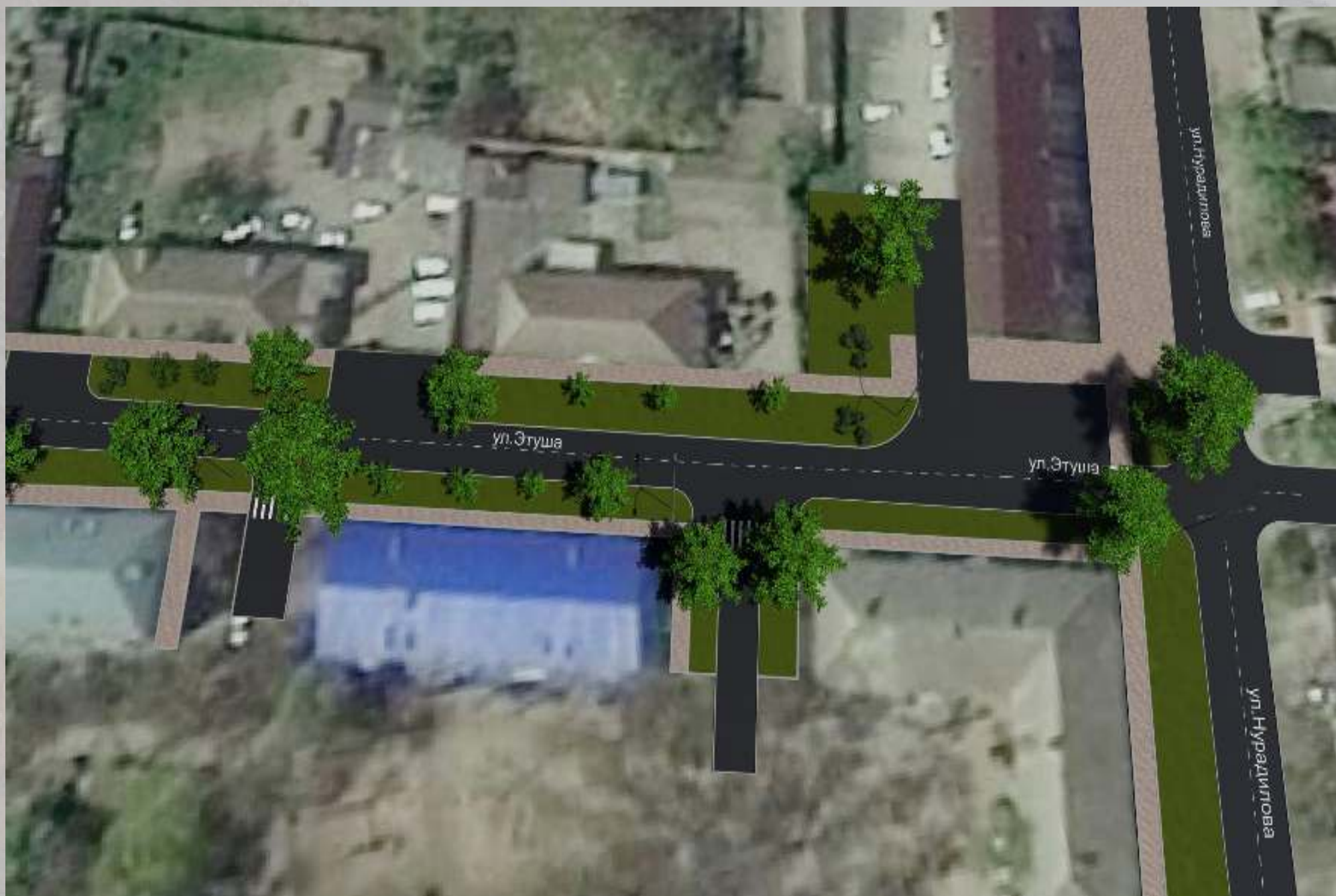
«Благоустройство общественной территории в г. Малгобек (ул. Этуша - от ул. Базоркина до ул. Нурадилова)»