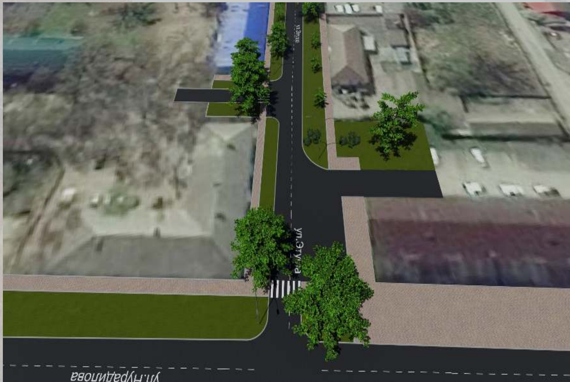
«Благоустройство общественной территории в г. Малгобек (ул. Этуша - от ул. Базоркина до ул. Нурадилова)»